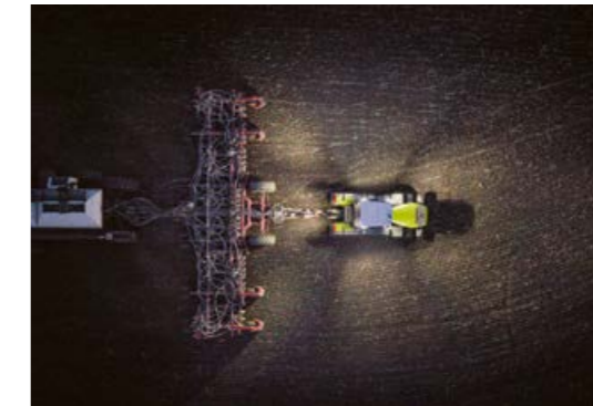
◀ El paquete de iluminación high-end, con hasta 22 faros LED, ilumina su entorno en un radio de 360° con 53.400 lumen. Todos los faros pueden ser ajustados adaptándolos a su trabajo.