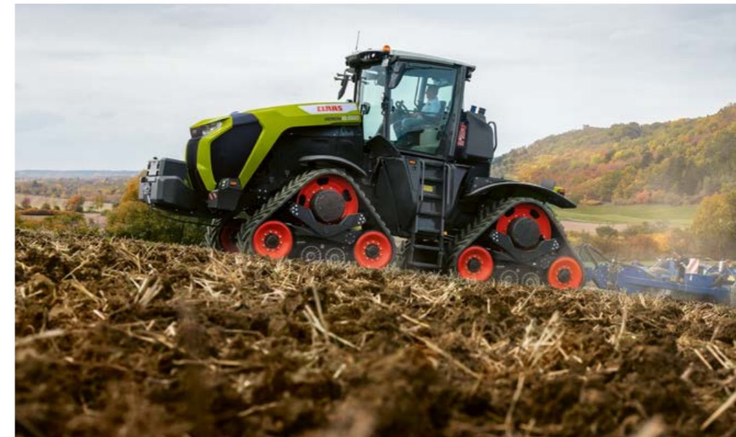
◀ El concepto de suspensión – empezando con el tren de rodaje de orugas con características de amortiguación, pasando por la suspensión de la cabina a 4 puntos, hasta el asiento premium amortiguado – ofrece en el XERION un confort de conducción especialmente alto.