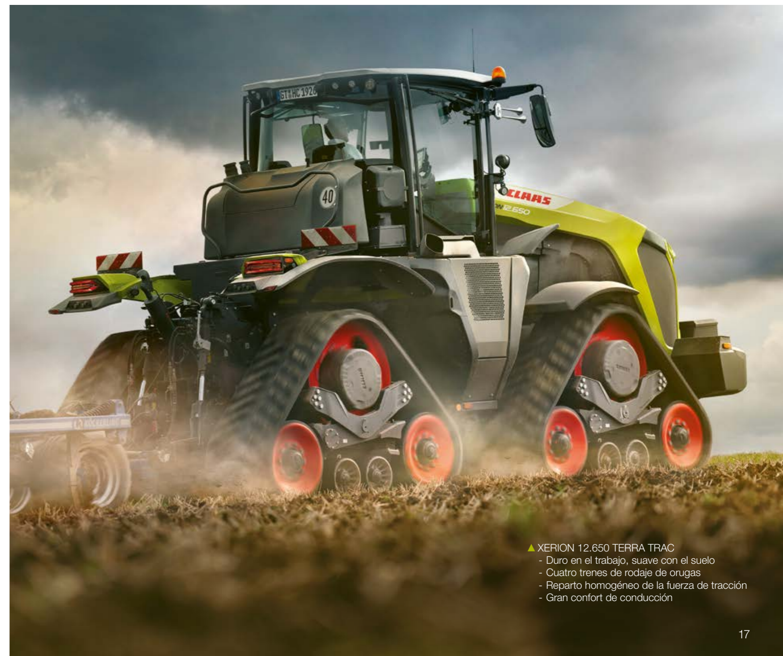
▲ XERION 12.650 TERRA TRAC - Duro en el trabajo, suave con el suelo - Cuatro trenes de rodaje de orugas - Reparto homogéneo de la fuerza de tracción - Gran confort de conducción