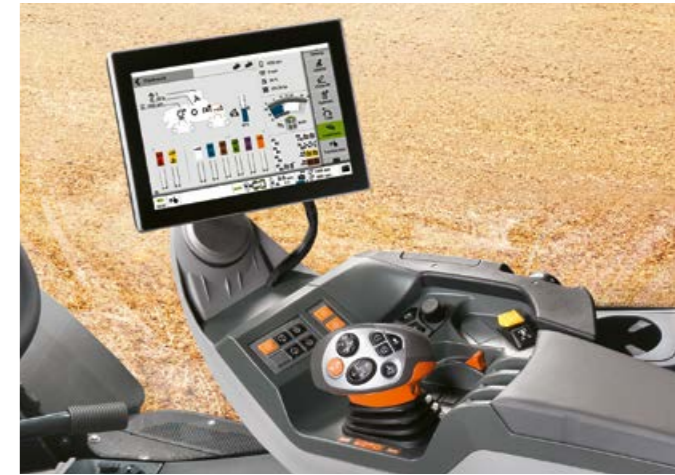
▲ Fácil manejo. Ajuste intuitivo de la máquina y el mejor confort de manejo con el sistema de información de a bordo CEBIS y el mando multifuncional CMOTION.

Paquetes de iluminación high-end, con hasta 22 faros de trabajo, cubren su entorno de una luz diurna. Usted siempre tiene la mejor visión de los implementos y de la parcela.