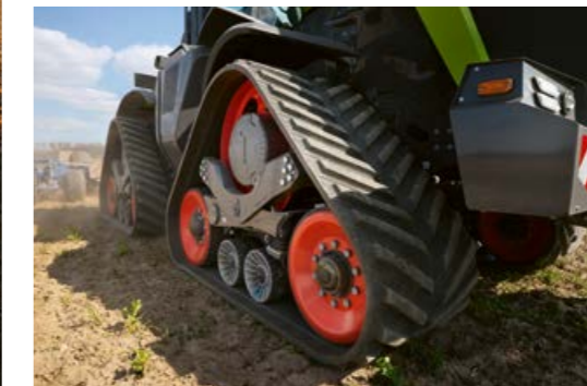
◀ Dos anchuras de cinta de rodaje (914 mm o 762 mm) garantizan un máximo cuidado del suelo. Con las cintas de rodaje más estrechas, el XERION se mantiene por debajo de los 3 m de anchura.