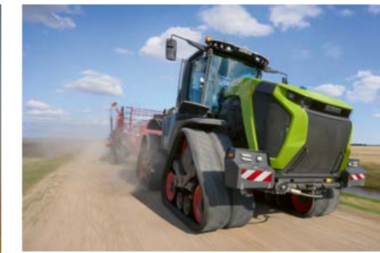
◀ 40 km/h en punta. También con el XERION TERRA TRAC avanza rápidamente y reduce en gran medida los tiempos ineficientes en carretera.